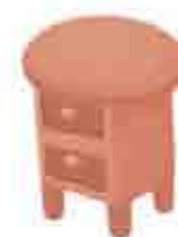
TABLE DE CHEVET